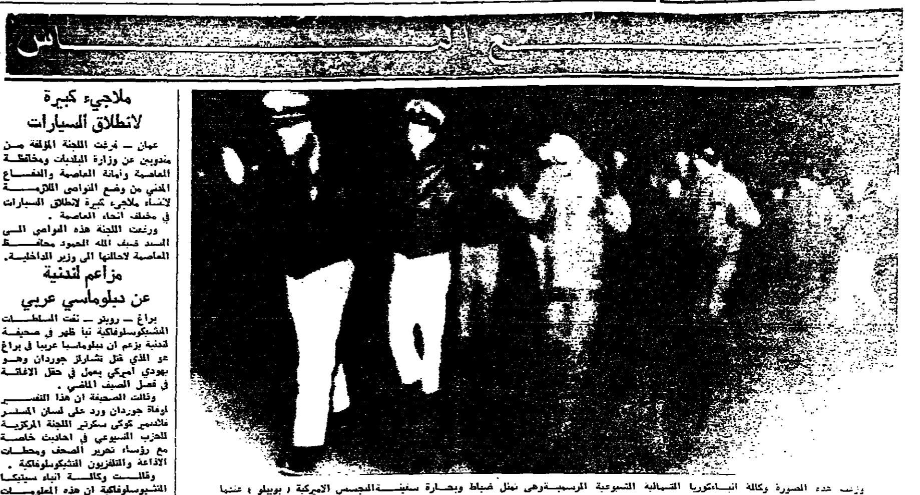
وزعت هذه الصورة وكالة انباء سوريا الشمالية التسوية المرسبة وهي نقل ضباط وبنسنة الجنود الامريكى ( بويلو ) عنيا اسيرة زوارى جيش الشعب السوري . وهذا الضابط هو الذي وزعته الوكالة السورية شرحا للصورة ( المورة من اليونانيديرس )

ويستحق الهبة ده كيلومترا من قاع العقدة افس . وشملت المرحلة الاولى من عملية افس الاول ٢٤ كيلومترا من التماسيح الى كيريت . ومن المقرر ان يبدأ الهبة اليوم مرحلة ثالثة تشمل ٧٨ كيلومترا من بحيرة التماسيح الى بور سعيد . وتجري عمليات المسح استعدادا للترحال عن ١٥ سفينة تجارية اجنبية محتجزة في القارة منذ حرب حزيران في السنة الماضية . ولكن ان ثمة عشرة عوالم رئيسية في القارة بنها اربع بوارج مرسية وغرقت حلة قارة السوسان من غير التوقع ان ترال هذه الموانئ قبل نهاية شهر اذار القادم . وذكرت وكالة انباء الشرق الاوسط ان الحكومة واقتت على شراء ١٨ الف طن من القمح لتعويض الخسارة الاجبرية « اوبزرفر » التي تبلغ زنتها ١٧٠١٢